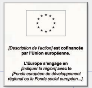
Maquette d'une plaque métallique gravée :

Un correspondant communication Europe est à votre disposition pour : - vous conseiller, - vous fournir des supports, des idées et des contenus, - vous donner les contacts utiles ... et répondre à toutes vos questions.