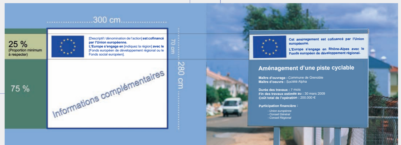
Exemple de panneau d'affichage :